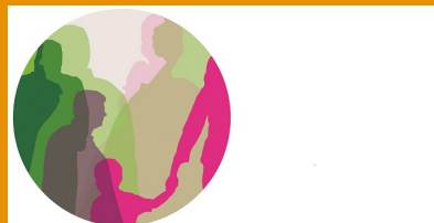
Miteinander in Konstanz e.V.